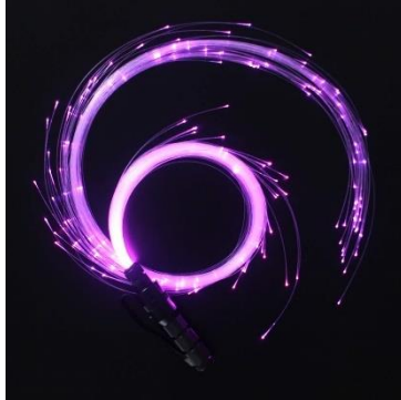
Kiểu cắt tỉa từ ngắn đến dài theo tuần tự

Các sợi quang nên được cắt tỉa với các độ dài, ngắn khác nhau vừa giúp thực hiện các động tác khiêu vũ dễ dàng hơn, vừa tạo được phong cách cá tính riêng. Quý khách có thể tham khảo các kiểu cắt tỉa sau: