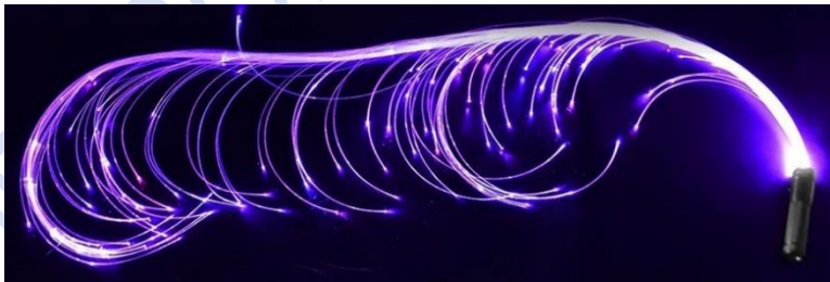
Kiểu cắt tỉa ngắn dài so le đan xen

Quý khách có thể mua riêng bó sợi quang để dự phòng, thay thế có bán tại Đèn Sợi Quang Việt